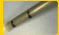
長期使用チューブ